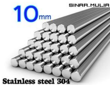
Gambar 3. Ass Stainless Steel

Pada turbin angin ini memerlukan poros utama yang berguna untuk pusat gravitasi dan menopang bentuk keseluruhan dan poros utama ini juga harus kuat menahan putaran turbin angin, pada alat ini digunakan komponen mekanis yang bernama Ass stainless steel dengan panjang 450 mm dan berdiameter 10 mm.