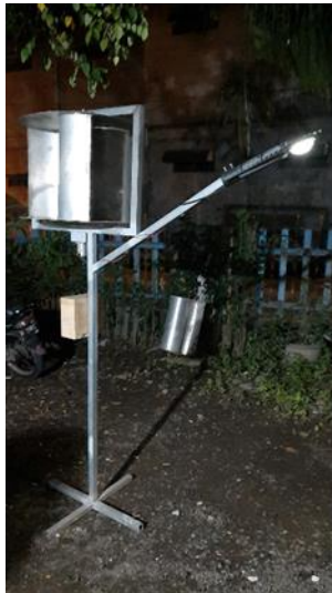
Gambar 6. Hasil Produk