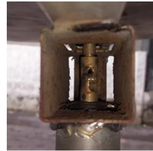
Gambar 5. Pengaplikasian

Diharapkan dengan bagian tersebut turbin angin savonius bisa memaksimalkan kecepatan angin yang ada dan ketika berputar minim getaran terjadi sehingga konversi energi mekanis ke energi listrik berjalan dengan lancar tanpa adanya kendala teknis dan alat berjalan sebagaimana mestinya.