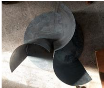
Gambar 2. Desain Turbin Savonius

Pada turbin angin ini memerlukan poros utama yang berguna untuk pusat gravitasi dan menopang bentuk keseluruhan dan poros utama ini juga harus kuat menahan putaran turbin angin, pada alat ini digunakan komponen mekanis yang bernama Ass stainless steel dengan panjang 450 mm dan berdiameter 10 mm.