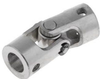
Gambar 4. Cardan Joint Gimbal Couplings

Penopang utama ini memerlukan penyelaras agar tidak mengurangi transfer torsi antara penopang utama dengan poros generator, dalam kasus ini dapat digunakan perangkat mekanik yang bernama Cardan Joint Gimbal Couplings yang biasa disebut kopel.